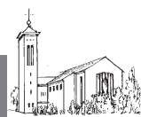
St. Josef Jägersburg